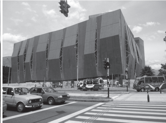
Figura N° 10 Complejo Ruta N