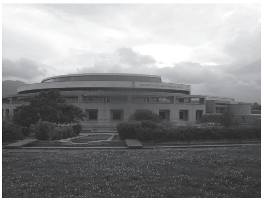
Figura N° 2 Biblioteca Virgilio Barco Vargas

Una de las propuestas más emblemáticas del Plan Zonal del Centro es la conocida como Manzana 5, un gran proyecto de iniciativa pública (5.800 m 2 ) para consolidar la vocación turística y cultural del centro de la