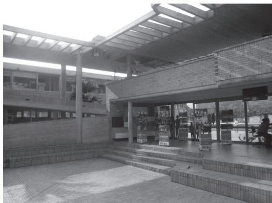
Figura N° 7 Interior del Centro de Desarrollo Cultural Moravia