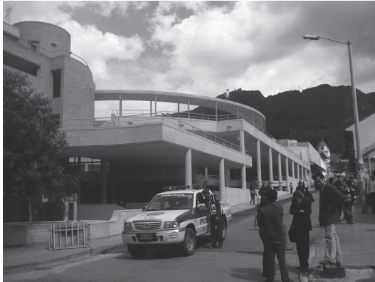
Figura N° 4 Centro Cultural Gabriel García Márquez