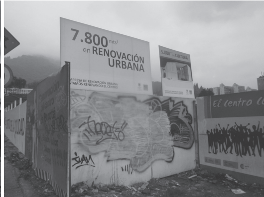
Figura N° 5 Predios de Manzana 5