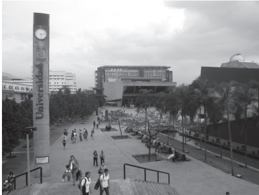
Figura N° 9 Eje Carabobo