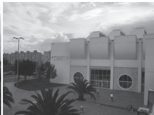
Figura N° 3 Biblioteca El Tintal