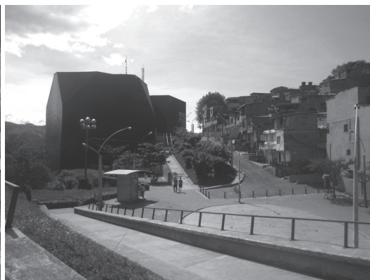
Figura N° 8 Parque Biblioteca España