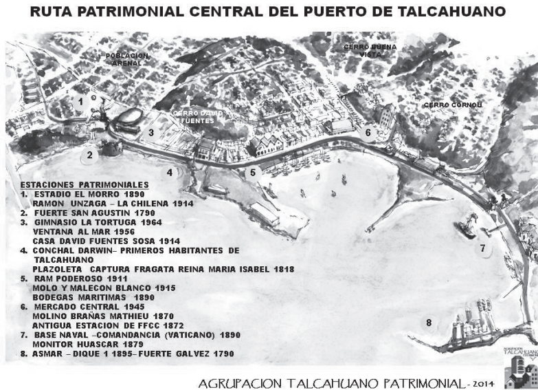
Figura N° 4 Ruta Patrimonial Central