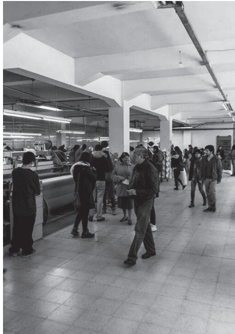
Figura N° 2 Recorrido interior ex Fábrica Bellavista, Día del patrimonio 2015