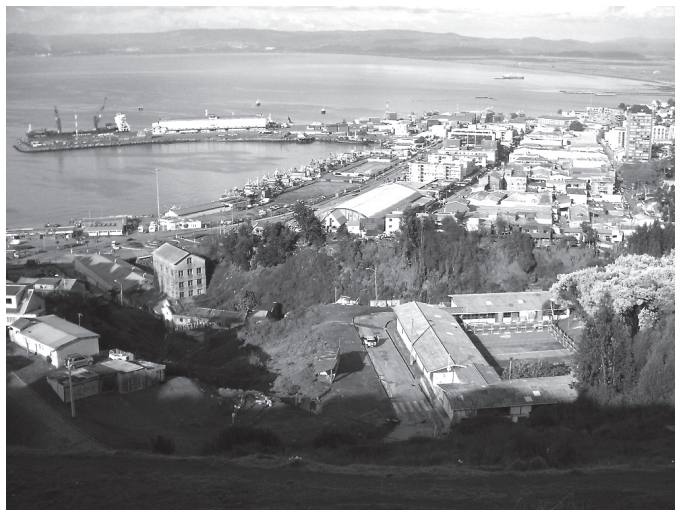
Figura N° 3 Ex Molino Brañas Mathieu en el contexto del puerto de Talcahuano