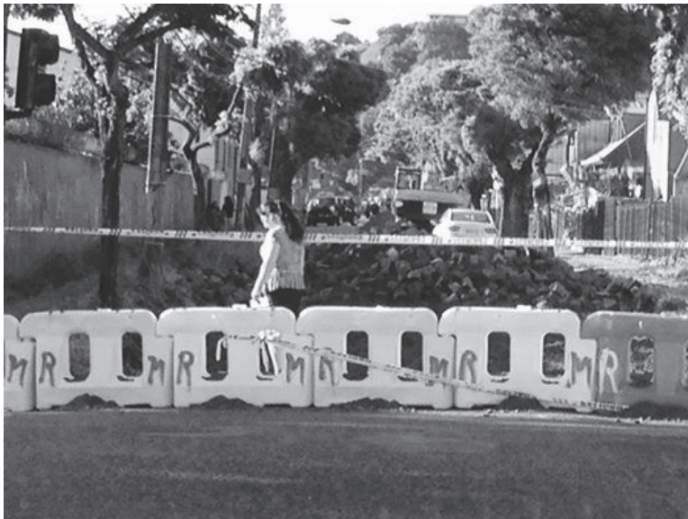
Figura N° 8 Campaña #Sí a los adoquines de Concepción, situación calle Pelantaro esquina Las Heras, noviembre de 2014