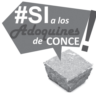
Figura N° 7 Campaña #Sí a los adoquines de Concepción

En el caso de #Sí a los adoquines de Concepción la agrupación lidera una acción ciudadana por la recuperación del patrimonio de los barrios céntricos que se ve amenazado por el desarrollo del plan de pavimentación del centro por parte del Municipio de Concepción, planteando una acción que combina una fuerte campaña por redes sociales de Facebook y Twitter con la participación del equipo de arquitectos como asesores de la comunidad en talleres en que se explica el valor del adoquín.