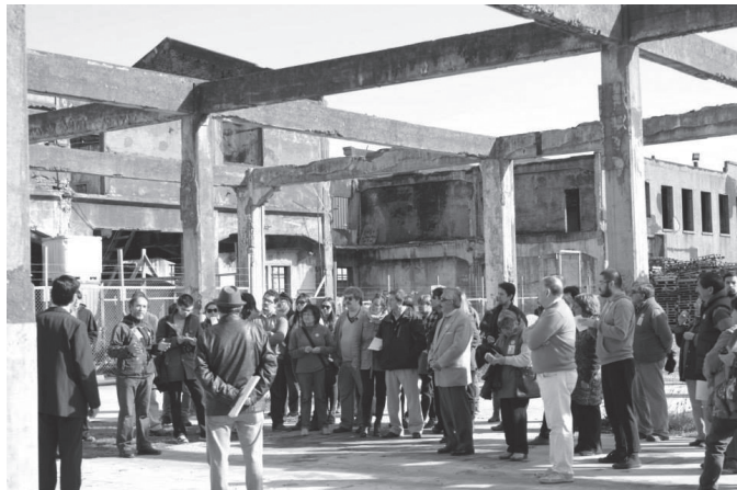
Figura N° 1 Visita a instalaciones abandonadas, Ex Fábrica Italo Americana de Paños (FIAP), Día del patrimonio 2014